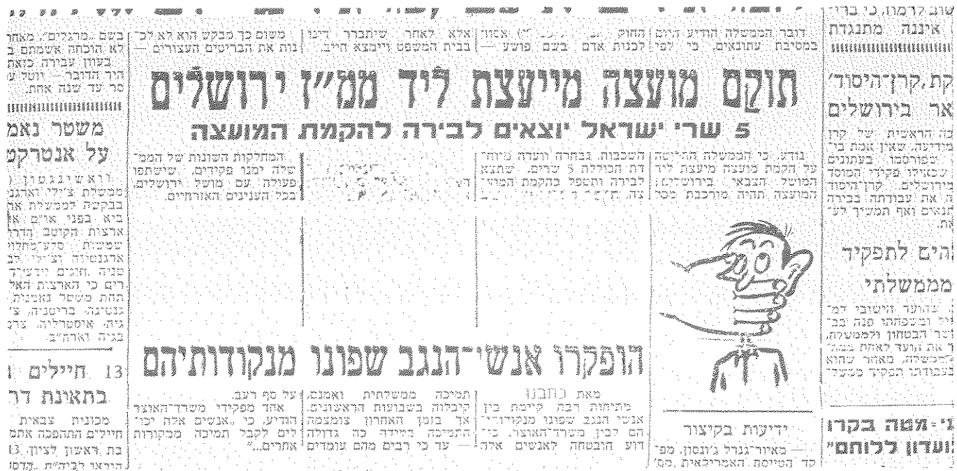
מספרי הצנזור ר'שיתמית פיות" ב'מברק" (30.7.1948)