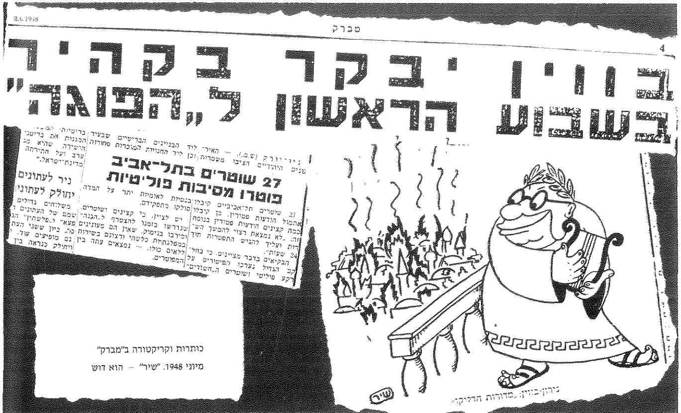
כותרות וקריקטורה ב"מברק" מיוני 1948. "שיר" — הוא דוש

ב-4 במרס 1948 אנו מוצאים ידיעה, שהבריטים מונעים ממוכרות ועדת הביצוע של האו"ם (שנועדה להוציא לפועל את החלטת החלוקה) יכולת תנועה, ומזהירים שכוחות הביטחון שלהם לא יכולים להגן על חבריה בסיווריהם ברחבי הארץ. בגיליון מוצאי שבת, 6 במרס 1948, הופיעה ידיעה בעמוד הראשון, שכותרתה: "פס לבן על מכוניות משווריינות". בכותרת נכתב: "סימן היכר בשביל הכנופיות — פקודת מפקד המשטרה האנגלי." בידיעה הודגש, שמפקד המשטרה בארץ פרסם פקודה לפי חוקי ההגנה, לפיה צריכות כל המכוניות המשווריינות, שאינן שייכות לצבא או למשטרה, לשאת סימן היכר מיוחד: פס לבן מסביב